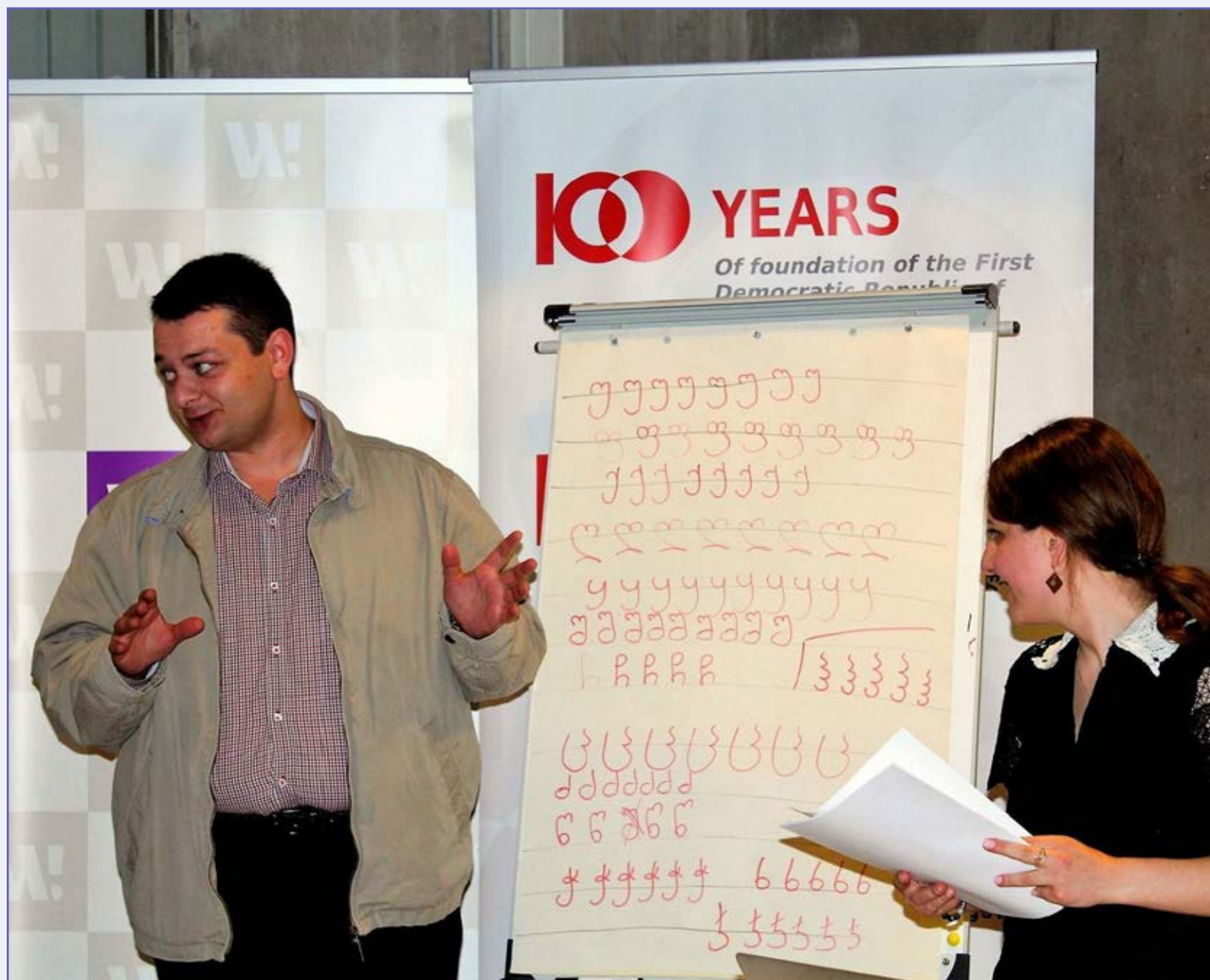
Warsztaty alfabetu gruzińskiego.

W ramach projektu na warsztaty zaprosiliśmy 30 studentów Uniwersytetu Warszawskiego – Polaków, Ukraińców, Azerów, Kazachów, Portugalczyków itp. Podczas warsztatów poznali osobiście gruzińskiego alfabetu. Dowiedzieli się, że jest on jednym z najstarszych