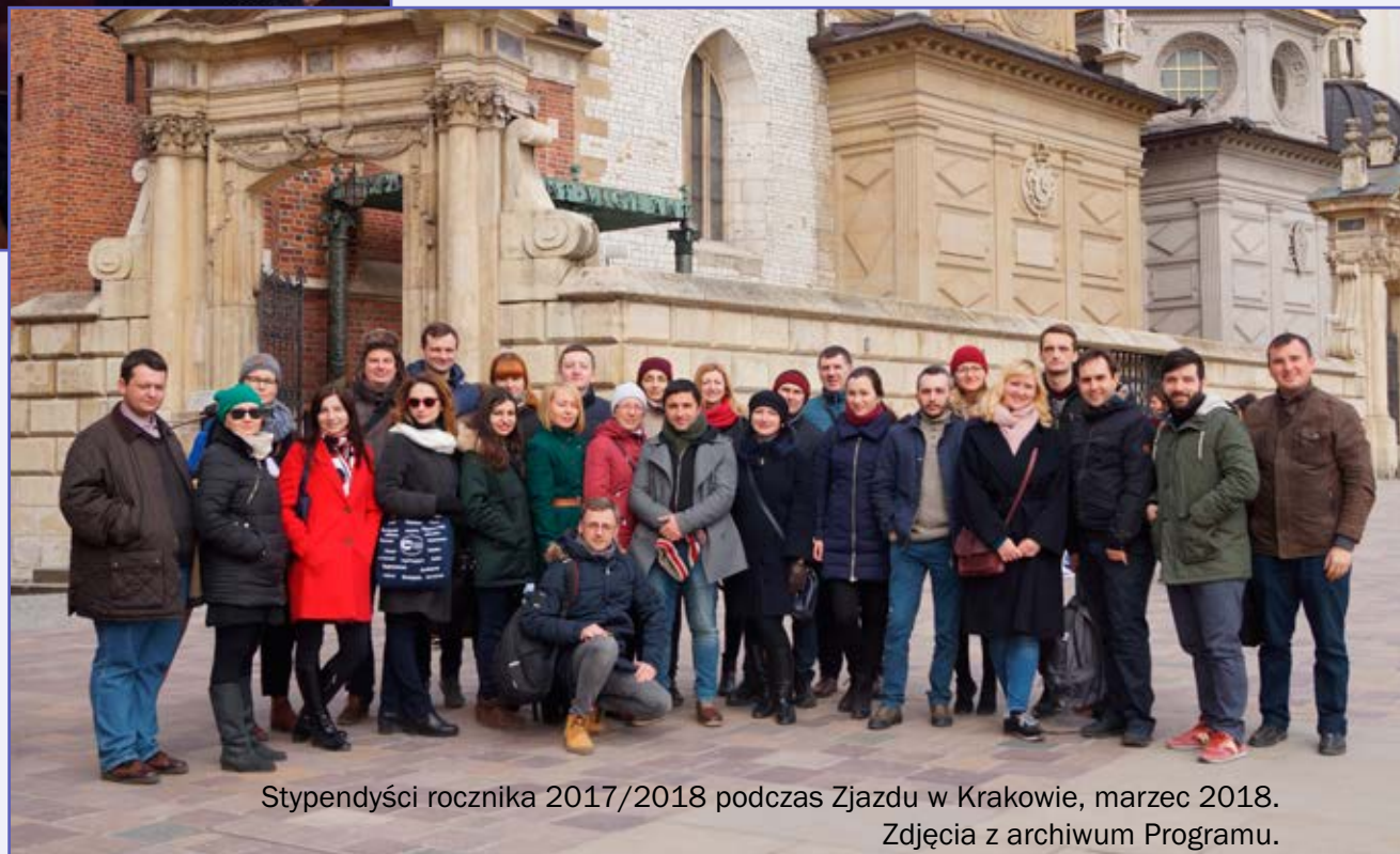
Stypendyści rocznika 2017/2018 podczas Zjazdu w Krakowie, marzec 2018.