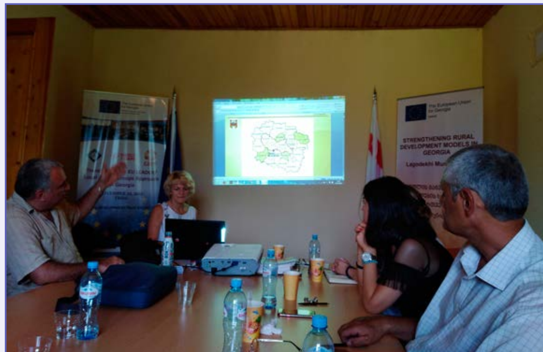
...oraz w Lagodekhi.