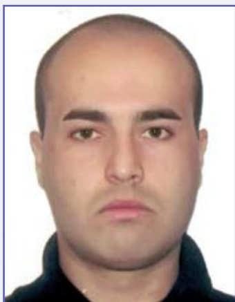
Anzor Burjanadze, Gruzja