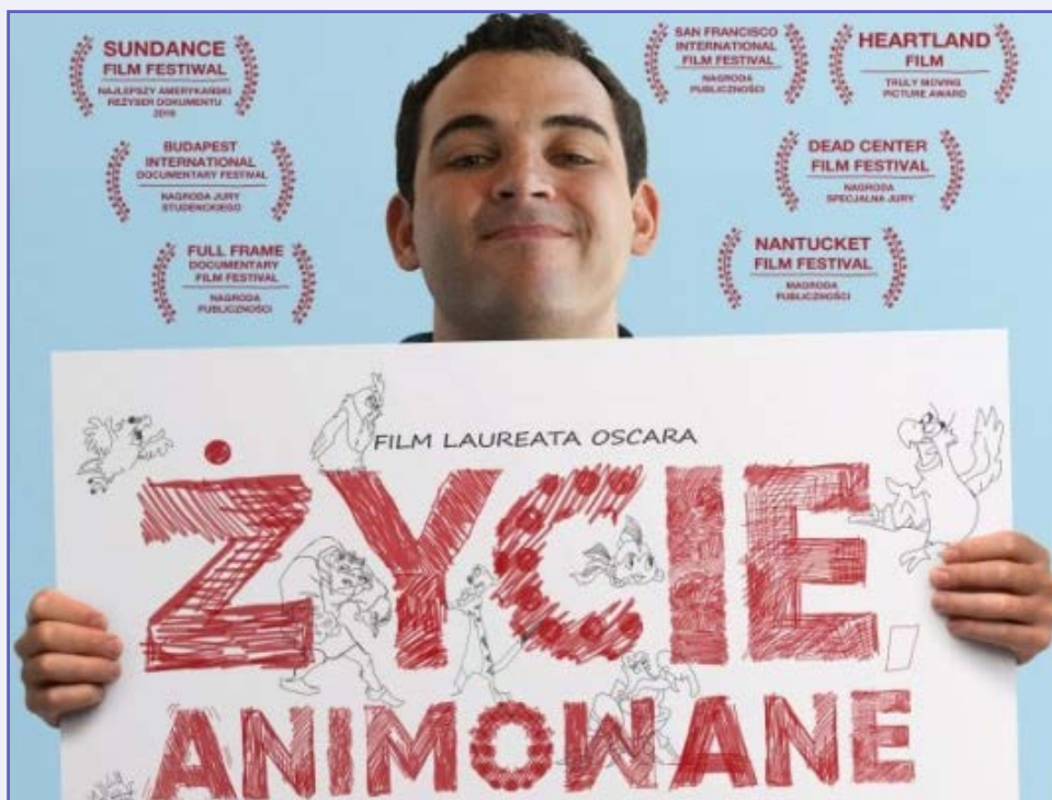
Plakat filmu „Życie animowane”.

Pamiętam, że w Dniu Świadomości Autyzmu (2 kwietnia, przyp. red.) wspólne z Kirklandystami oglądaliśmy film „Życie animowane”. Ta poruszająca opowieść o autystycznym chłopcu zwiększyła jeszcze moje przekonanie, że musimy pomagać ludziom z niepełnosprawnościami. Dzięki naszemu wsparciu może uda im się normalnie żyć, a bez naszej pomocy ich życie będzie tylko wegetacją.