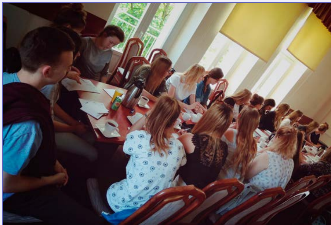
Uczestnicy warsztatów organizowanych w ramach projektu.

Projekt Szkoła Liderów zatytułowany „Naukowa komunikacja w środowisku akademickim: sekrety pisania prac naukowo-badawczych” przygotowany i wdrożony został przez ubiegłorocznych stypendystów w partnerstwie z Uniwersytetem im. Adama Mickiewicza w Poznaniu. Był realizowany na terenie UAM w maju 2018 roku.