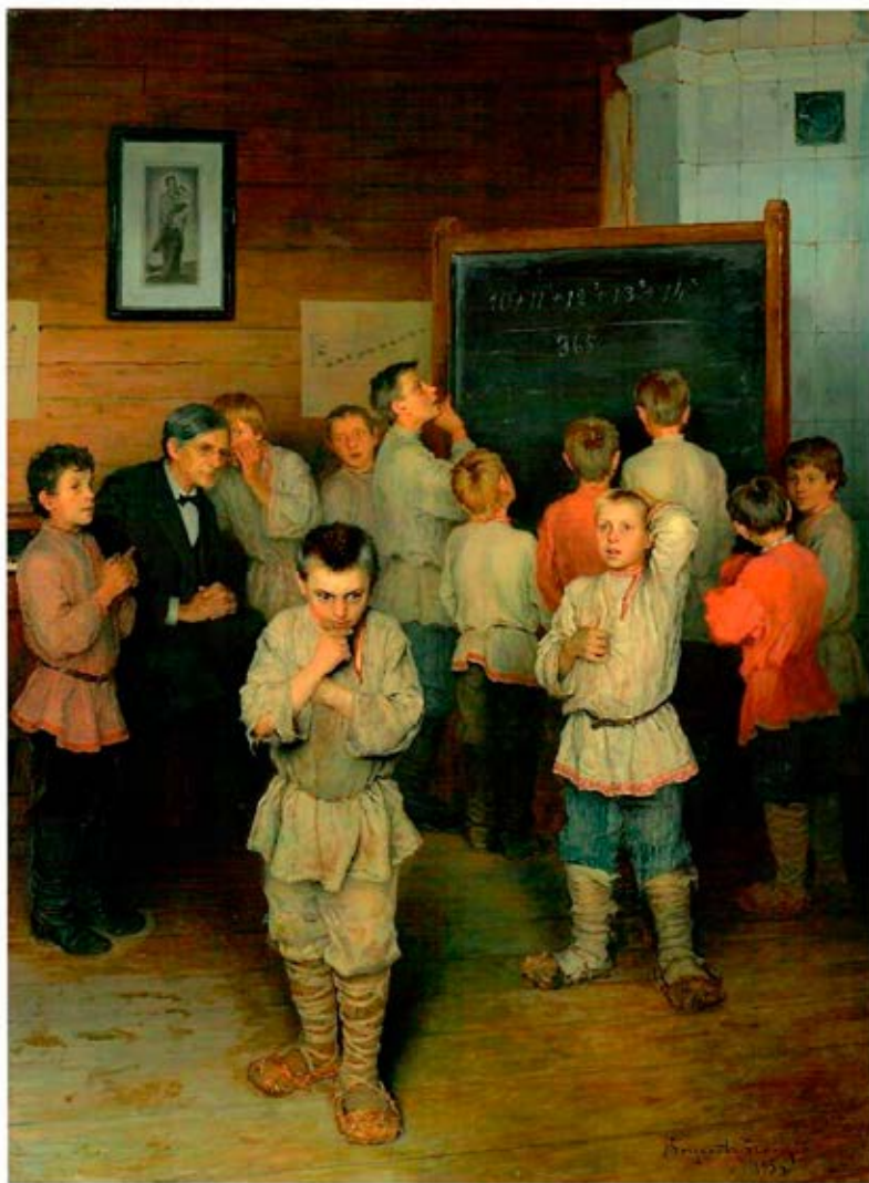
Научная коммуникация в академической среде: секреты написания научно-исследовательских работ

W trakcie uroczystego zakończenia uczestnicy otrzymali certyfikaty. Wspólna praca, zabawa i poczęstunek zbliżyły do siebie słuchaczy oraz prowadzących zajęcia. Wielu uczestników deklарowało, że zajęcia odświeżyły w nich ducha nauki. Wspólna praca, zabawa i biesiada zbliżyły do siebie słuchaczy oraz prowadzących zajęcia.