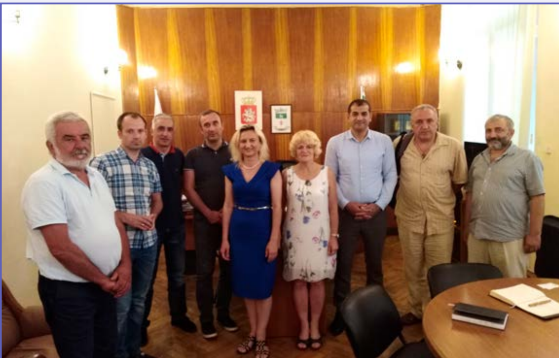
Wspólne zdjęcie z uczestnikami spotkania w Lagodekhi.

żyli, jak nadszedł zmierzch. Strudzony pracą Pan Bóg udawał się na spoczynek, kiedy zauważył rozbawiony naród, który dopiero wówczas zaczął dopominać się o kawałek ziemi. I gdy Pan Bóg nie chciał im nic już dać, wówczas powiedzieli, że musieli podjąć swych gości i nie mogą wstać od stołu, aż nie wzniosą toastu za Trójcę Przenajświętszą i Bogarodzicę Maryję Pannę. Zwrócił się wówczas do nich Pan Bóg, mówiąc: „Kiedy wszyscy walczyli o ziemię dla siebie, wy się wesiliście, biesiadując i ciesząc się tym, co macie. Rozdałem jednak już tereny, które miałem. Zachowałem jednak pewien mały skrawek, który jest tak piękny, że chciałem go zatrzymać dla siebie. Ale spodobał się mi i podaruję go wam”. ■