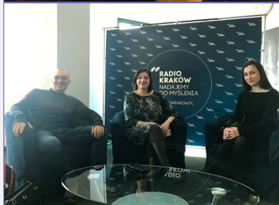
Stypendyści podczas wizyty w Radiu Kraków. Zdjęcia z archiwum Programu.