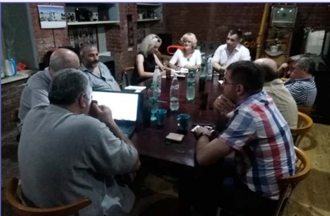
Spotkanie w Tbilisi....