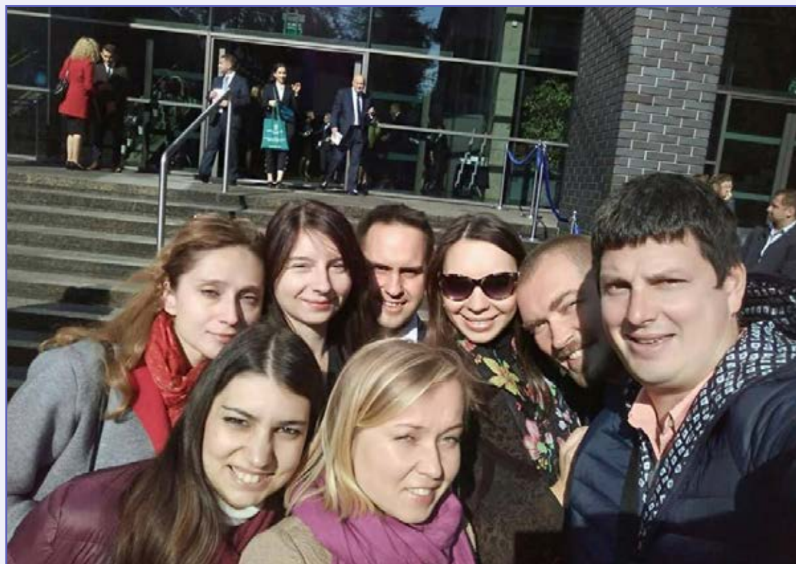
Autorka artykułu z koleżankami i kolegami Kirklandystami swojego rocznika.

Aby zmniejszyć tęsknotę i napięcia dnia codziennego, zaczęłam szukać odpowiedniego dla mnie wolontariatu. Złożyłam wniosek do Maltańskiego Centrum Pomocy Niepełnosprawnym